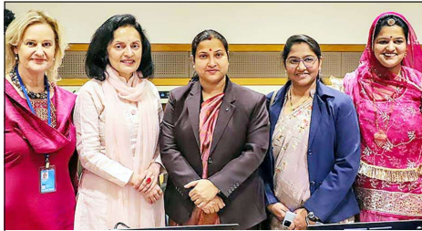
સંયુક્ત રાષ્ટ્રમાં ભારતના કાયમી પ્રતિનિધિ રવિચર ક્રોળે ભારતની પંચાયતી રાજ વ્યવસ્થામાં મહિલાઓના નેતૃત્વમાં થયેલી તૈયારી તોવવાના બાવરુ પ્રશ્નકારા દ્વારા કરી હતી.

અત વર્ષથી રાફા ખેતર ઈઝરાયેલ દ્વારા સંચાલિત થઈ રહ્યું છે. ઈઝરાયેલી સેના અને રાફા ખેતર ઈઝરાયેલ દ્વારા સંચાલિત થઈ રહ્યું છે. ઈઝરાયેલી સેના અને રાફા ખેતર ઈઝરાયેલ દ્વારા સંચાલિત થઈ રહ્યું છે.